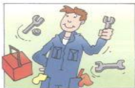
1 Lui fa il meccanico.