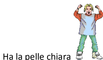
Ha la pelle chiara