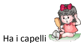
Ha i capelli

neri , bruni , castani , biondi , rossi , grigi ,