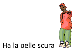
Ha la pelle scura