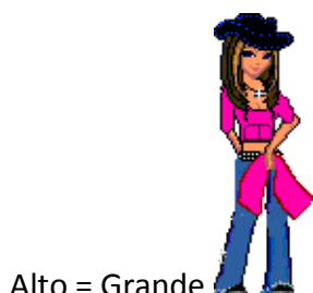
Alto = Grande